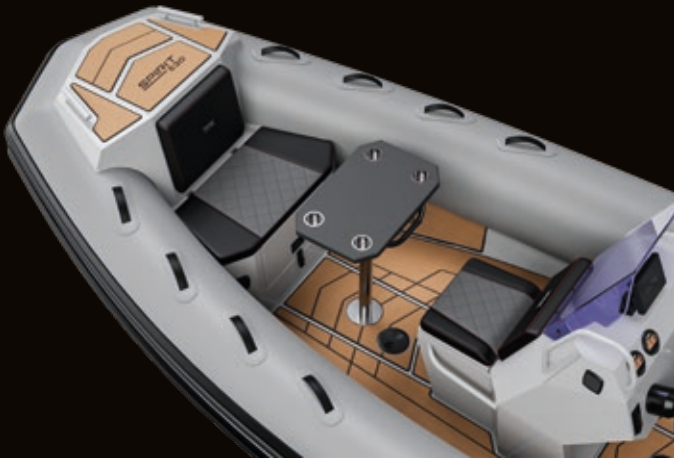
BUG PLATTFORM UND TISCH | BOW PLATFORM AND TABLE