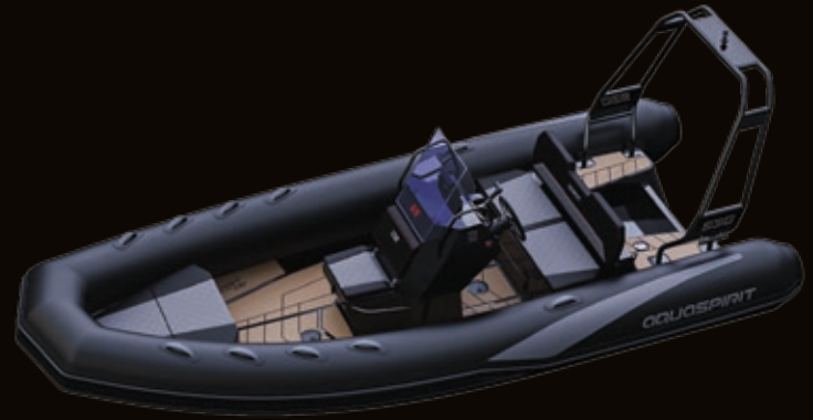
CENTER KONSOLE SCHWARZ | CENTER CONSOLE BLACK