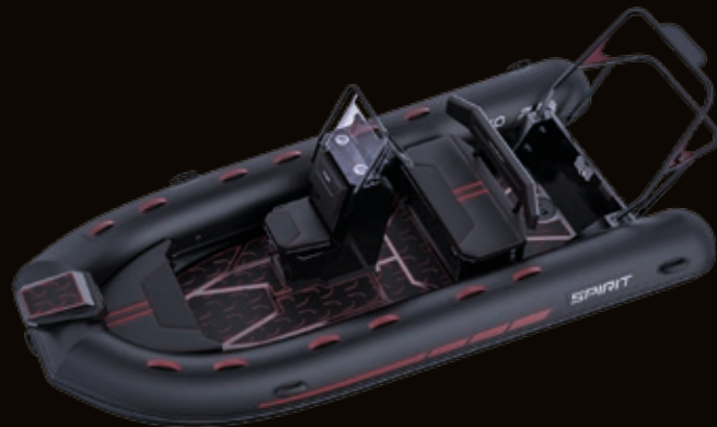
S450 C Black Edition