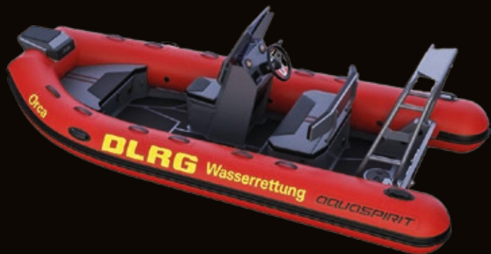
S450 C PRO Verion für DLRG | search and rescue