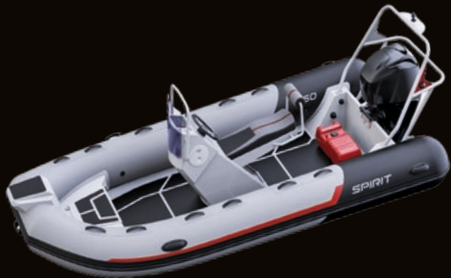
S450 SC mit Sportkonsole | with sport console